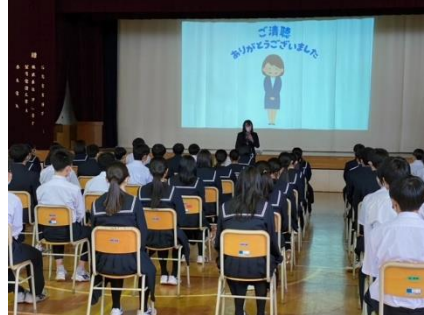
12月16日(金)2年性の講話会