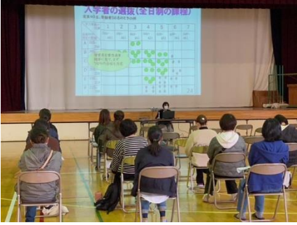
11月21日(月)2年保護者進路説明会