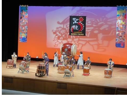
11月27日(日)龍響祭8組東山太鼓