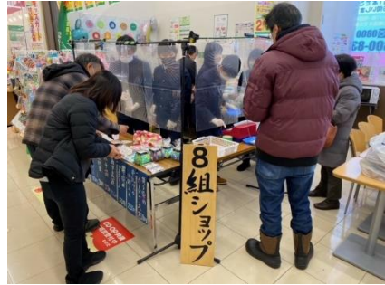
12月16日(金)8組地域販売学習