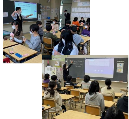
12月13日(火)東小学校出前授業