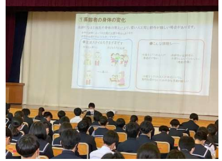
5月18日(木)1年「だて学」講話②