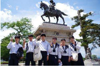
5月15日(月)～17日(水)3年修学旅行