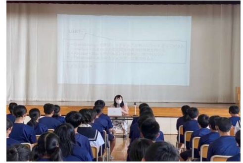
8月22日(火)2年性の講話会