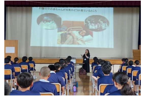
8月24日(木)1年性の講話会