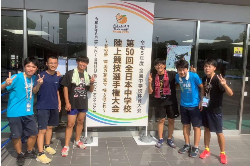
8月22日(火)～25日(金)全国中体連体育大会 第50回全日本中学校陸上競技選手権大会に陸上部生徒6名が参加しました