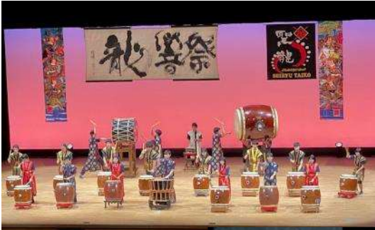
11月26日(日)龍響祭 支援学級の生徒が太鼓の演武を行いました