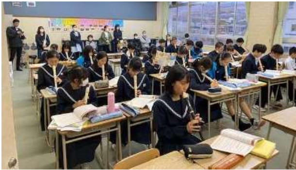
11月10日(金)久しぶりの授業参観実施