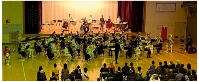
11月5日(日)北海道警察音楽隊演奏会 本校と伊達開来高の吹奏楽部が演奏に参加しました