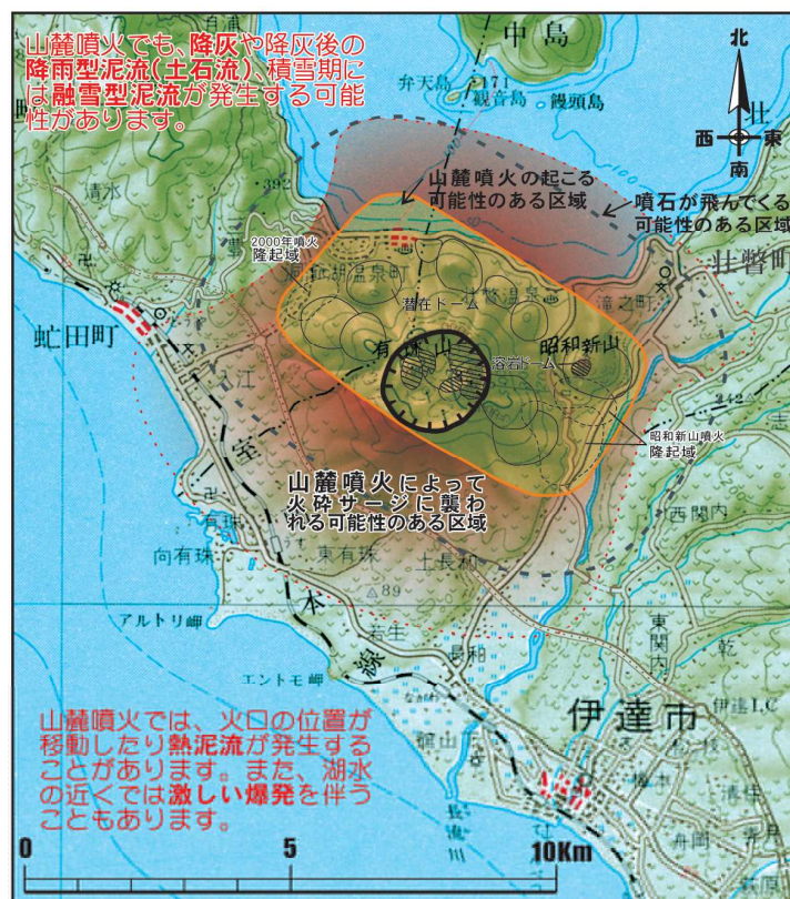
＜山麓噴火による火砕流・噴石の予測図＞