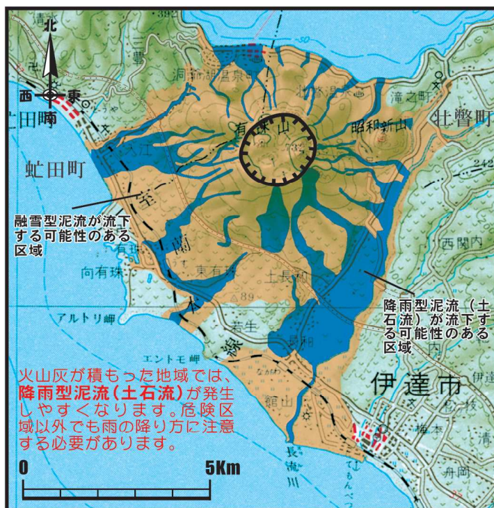
＜山頂噴火による融雪型泥流・降雨型泥流（土石流）の予測図＞