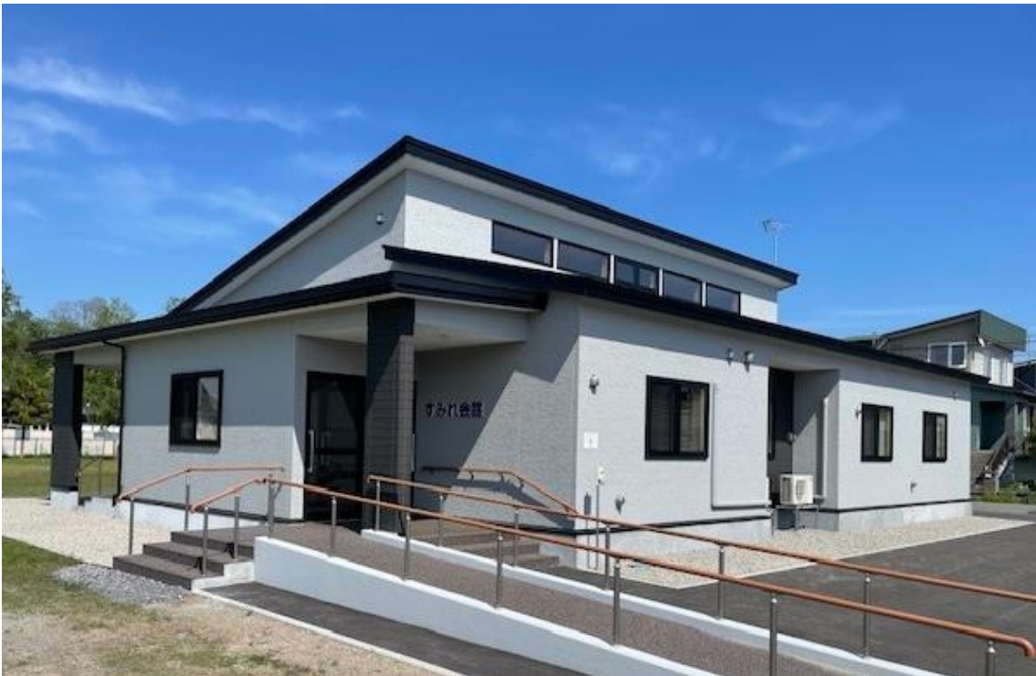
すみれ会館（伊達市山下町）