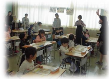
初めての参観授業(1年生)

16日(火)の参観日・全体懇談会・PTA総会にご参加いただき、ありがとうございました。授業終了後の全体懇談会では、短い時間ではありましたが、今年度の学校の教育活動について説明させていただきました。