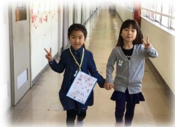
1年生学校探検から