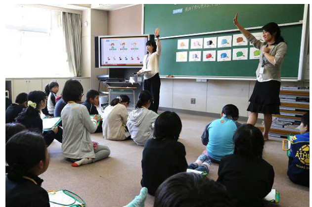
【公開した外国語活動の様子】

子どもたち一人一人が輝き成長する運動会にするためにご支援をお願いいたします。そして、6月2日は第62回を迎えました本校の運動会にご家族お揃いでお越しいただけますよう、併せてお願いいたします。