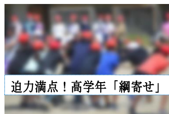
迫力満点！高学年「網球せ」