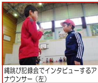
縄跳び記録会でインタビューするアナウンサー(左)

縄跳び記録会はたくさんのご参観とご声援をいただき、ありがとうございました。どの子も自分のこれまでの記録を少しでも超えようと集中して取り組みました。保健体育委員がアナウンサーとなり、記録と感想発表がありましたが、新記録が出て嬉しかった、悔しい、楽しかった、次も頑張りたいなど、素直な思いを表現できていました。ここで大切なことは、他の記録や感想を聞いた時、大きな刺激を受けるといことです。そして新たな目標や意欲はここから生まれてくるのです。そこに全校で取り組む大きな意味があると思います。また最後に子供たちには、記録会だけではなく、これまで続けて練習してきたこと、積み重ねてきたことこそが最も大切なことだと改めて伝えました。