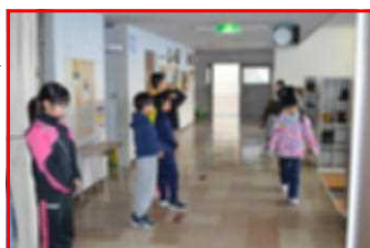
代表委員による朝のあいさつ運動。 寒い朝、元気な声で迎えます！

始業式では、元日に立てた新年の目標に向けて頑張っしてほしいと伝えました。また、今年は東京オリンピックの年なので、全力を出して競う選手を応援しながら、自分の目標を達成するための活力にもしてほしいと励ましました。2学期終業式で聞いた四つの目標を3学期用にわかりやすく内容をしばって伝えることもしました。