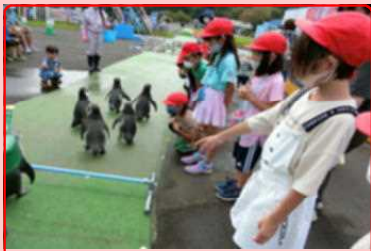
1・2年は写生会を兼ねて室蘭水族館への遠足です。かわいい動物に笑顔満開！