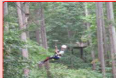
5・6年は宿研、大滝での自然とホテルを満喫！CMでおなじみのアクティビティに大歓声！