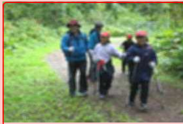
3・4年は大滝でルディック・ウォーキング体験。インストラクターからのレッスンを受け、森を散策！