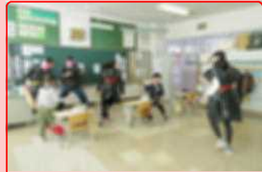
1年生の豆まきに6年生扮する鬼が登場！懸命に豆をぶつけて、見事に退治成功！