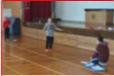
記録会後も北海道小学生なわとびチャレンジに挑戦するなど体力&技術UPを継続！