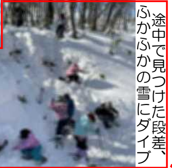
途中で見つけた段差、ふかふかの雪にタイプ