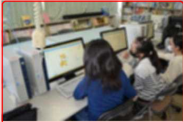
5年生、プログラミング教育で奮闘中！画面の猫を動かすプログラムを考えます。