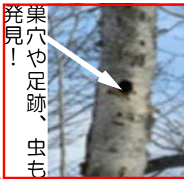
巣穴や足跡、虫も発見！