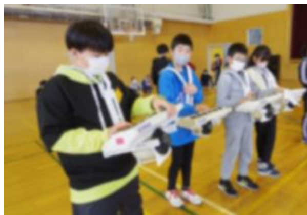
＜西小マーチを一緒に練習する子供たち＞

子供たち全員の輝く姿を閉校記念式典でご覧いただけるよう、健康管理には十分お気を付けください。