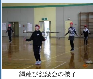
縄跳び記録会の様子

もちろん、中学生は高校入試を控え、入試で点数を取るための学力を前提に質問されることがほとんどです。受験で求められる国語力と、実生活で求められる国語力とは全く等しいとは言えませんが、将来的に身に付けておかなければならない国語の知識や技能、理解力、表現力は、テストでも問われます。