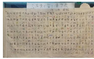
「三年生で習う漢字」(自由研究)