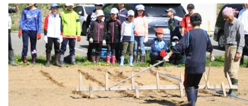
↑じゃがいもを植えよう！↓