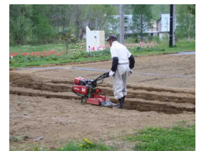
地域の方々のおかげで！