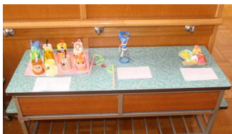
< 1年生の作品 >

力作の陰には、保護者の皆様のご協力も垣間見えました。いつもご支援ありがとうございます。