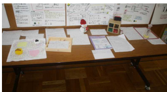
< 3年生の作品 >