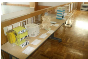
< 5・6年生の作品 >