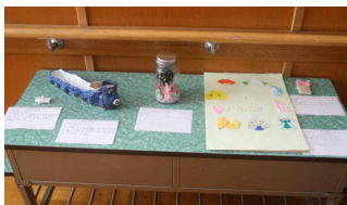
< 2年生の作品 >