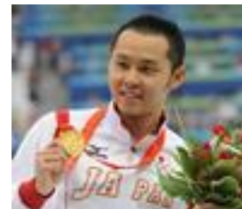
アテネ大会 北島選手