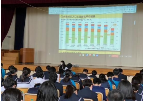
5月19日(木)伊達市健康福祉部による講話