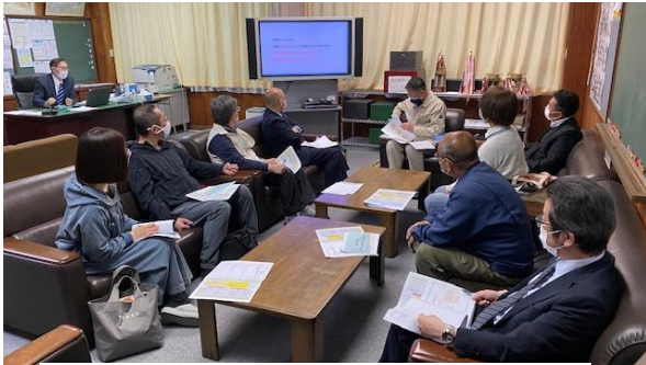
5月12日(木)第1回伊達中学校運営協議会