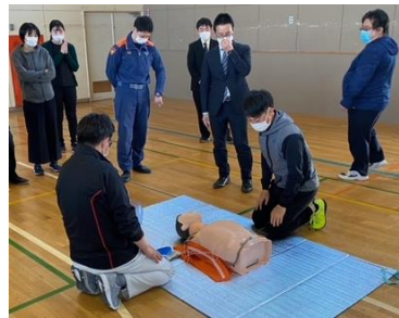
5月16日(月) 職員による救命救急講習会