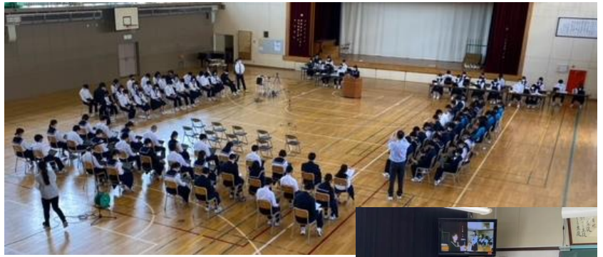
5月17日(火)生徒総会 体育館での活動の様子を各学級へ配信