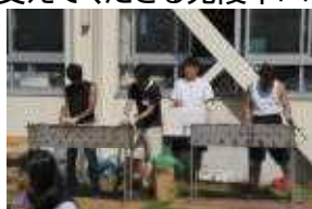
〈焼き物・ドリンク部門〉