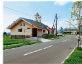
のどかな田園風景が広がる 「田園せきない」