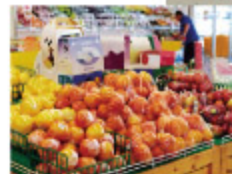
大型スーパーが 中心部にあり 買い物に便利