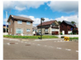
お店や病院が徒歩圏内 「プライム・ヘルシートウン」