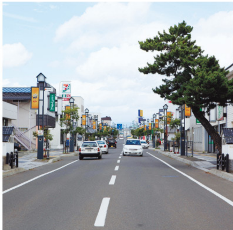
病院、金融機関、大型スーパーなどを集約した、コンパクトな街なみ

西胆振の中心都市である伊達市は、総合病院をはじめとした多くの医院や銀行、複数の大型ショッピングセンター、福祉施設などが揃っています。これらの施設の多くは、市街地のほぼ5キロ圏内に集まっており、買い物や用事を1回で済ませられるコンパクトな街なみを形成しています。