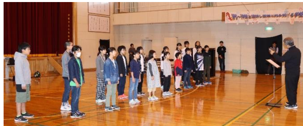
19名による全校合唱

23日、学校祭にお越しいただき、ありがとうございました。1～9年生19名で創り上げた学校祭、いかがだったでしょうか。「練習で積み上げてきた成果を出そう」「役目を果たそう」「自分の力を発揮しよう」と真剣に取り組む一人一人の姿には素晴らしいものがありました。お子様に限らず、目の前で躍動する児童生徒の姿に成長を感じていただけたことと思います。