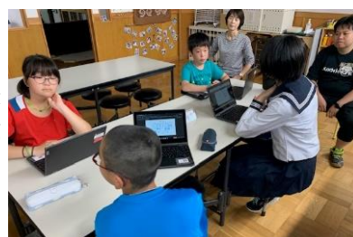
学校祭テーマについて 端末を使った話し合い

今回の学校祭では保育所も参加してくださいました。さらには、施設の方々作品展も開催でき、学校と地域施設がつながる大滝らしい学校祭であったと感じています。そして、何より、保護者の皆様はじめ、地域の方々がたくさん来てくださったこと、大変うれしく思います。皆様の拍手や温かい声掛けが子ども達の励み、頑張りにつながりました。今後も地域の方々に足を運んでいただける学校として、環境づくりを進めていきます。