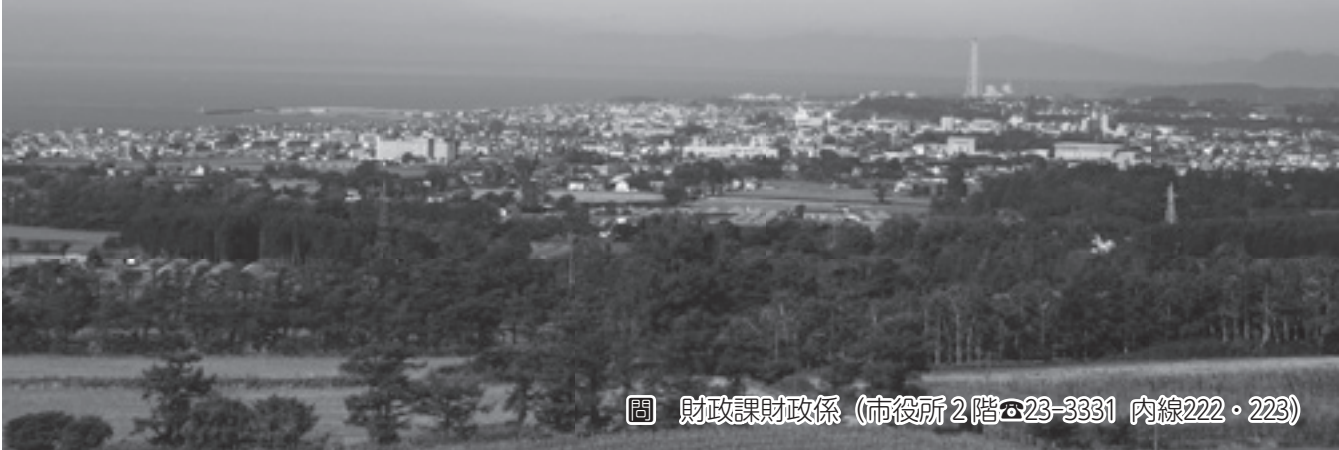
図 財政課財政係 (市役所2階 ☎23-3331 内線222・223)