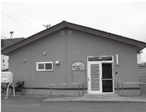
中央地区の子育て支援センター「えがお」