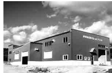
木質ペレット製造プラント