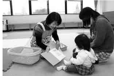
保健センターでのブックスタート事業の様子