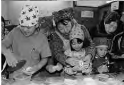
美味しいお餅になりますように