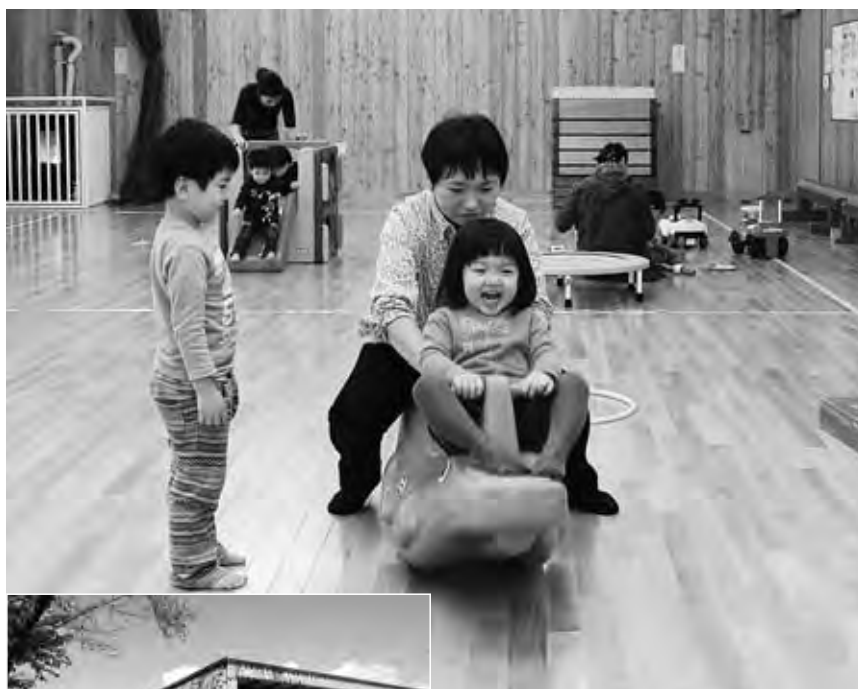
広い場所で遊ぶの、楽しい!

遊・ゆうホールは4月まで開設しています。詳しい日程は毎月の広報だて「行事・イベントひろば」をご覧ください。