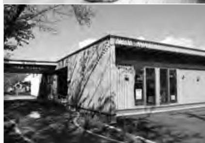
遊・ゆうホールを開設している「旭町児童館」