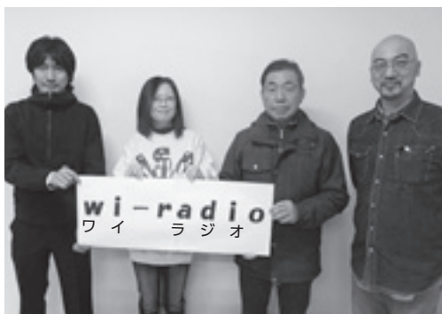
略称「ワイ・ラジ」。皆さんきいてくださいね。