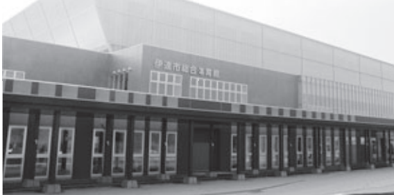
12カ所の施設のひとつ「市総合体育館」

専用のスタンプ用紙は、スタンプ設置施設に備え付けてあるほか、市ホームページからダウンロードして印刷することもできます。