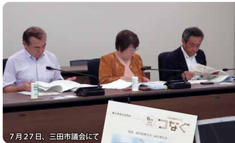
7月27日、三田市議会にて