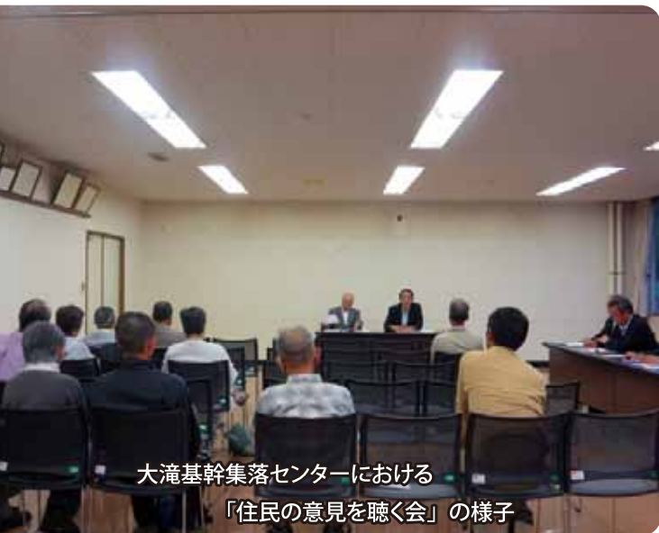
大滝基幹集落センターにおける「住民の意見を聴く会」の様子

そして、9月14日に第4回目の委員会が開かれ、旧伊達市と旧大滝村との合併後の伊達市議会議員選挙における選挙区の状況や他市町村議会における選挙区の設置状況等を調査して、次回の委員会において選挙区の在り方について協議することになった。