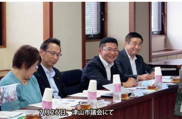
7月26日、津山市議会にて