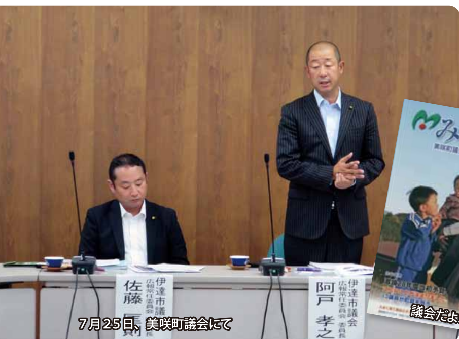
7月25日、美咲町議会にて

変わります！「伊達市議会だより」は大きく変わります!!多くの市民に見てもらえるように変わります!!!そして手前味噌に陥らないように。