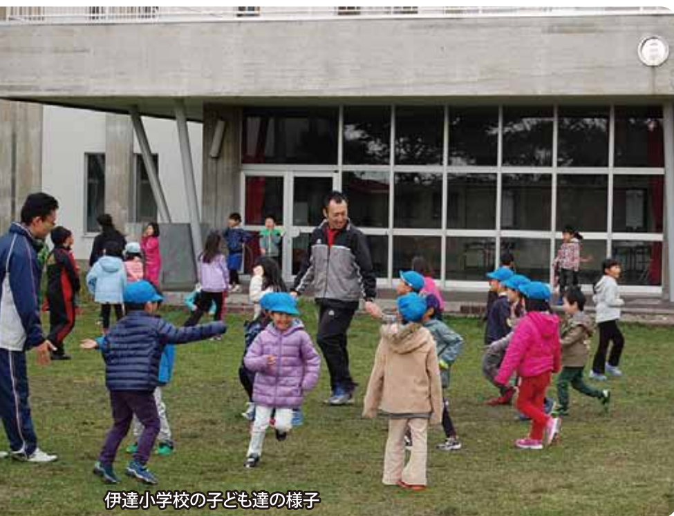
伊達小学校の子ども達の様子